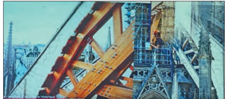
Unterbauung der großen Strebebögen