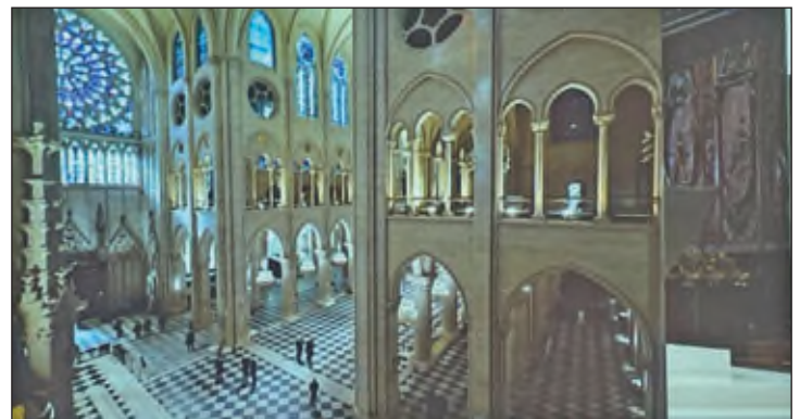
Innenansicht der neueröffneten Kirche