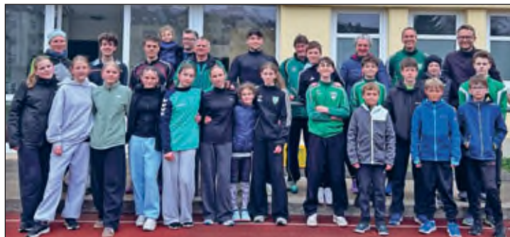
unsere Teilnehmer am Ostertrainingslager in Töpelwinkel